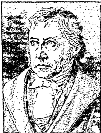
गेओर्ग विल्हेल्म फ्रेडरिक हेगेल. 65